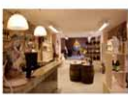
Winkelwerkzaamheden Bekijk project >