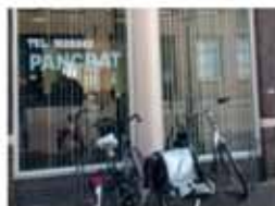
Vrouwengroep Bekijk project >