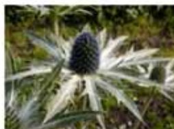
Tuinieren Bekijk project >