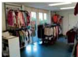
Tweedehands kledingwinkel Bekijk project >